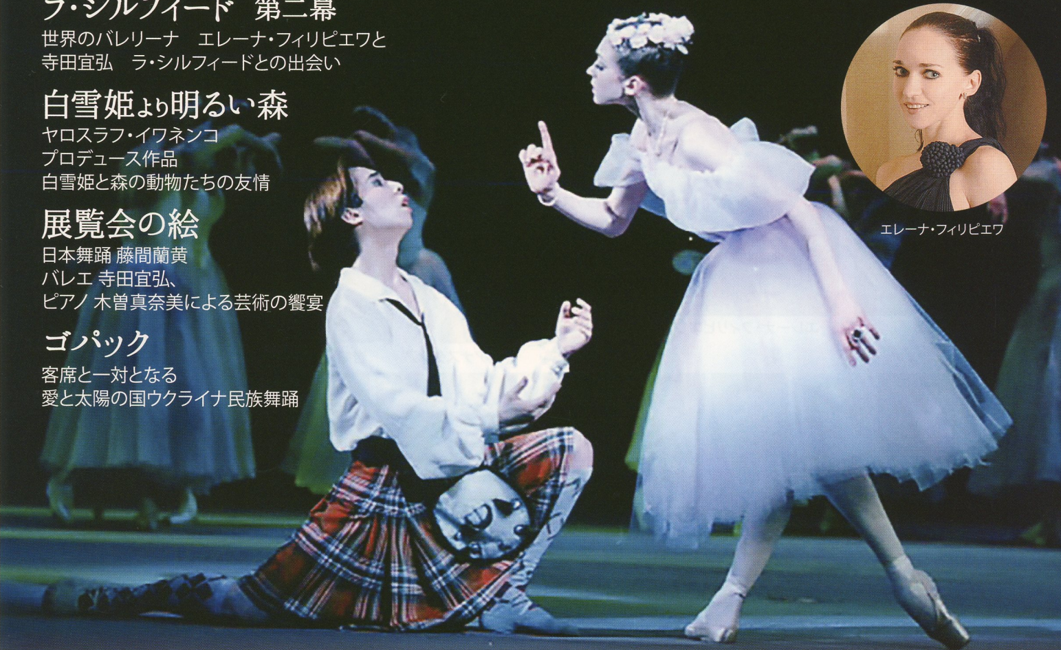
ラ・シルフィード